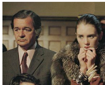
1977 VIOLETTE ET FRANÇOIS de Jacques Rouffio avec Isabelle Adjani