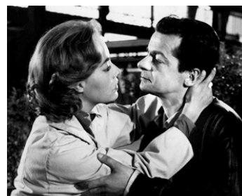
1958 ÉCHEC AU PORTEUR de Gilles Grangier avec Jeanne Moreau