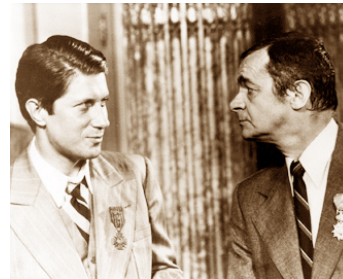
1975 LE BON ET LES MÉCHANTS de Claude Lelouch avec Jacques Dutronc