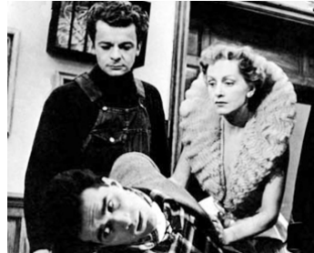
1949 LE PARFUM DE LA DAME EN NOIR de Louis Daquin avec Michel Piccoli, Hélène Perdrière