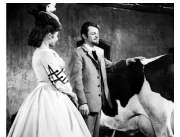
1956 LA FILLE ÉLISA de Roger Richebé avec Dany Carrel