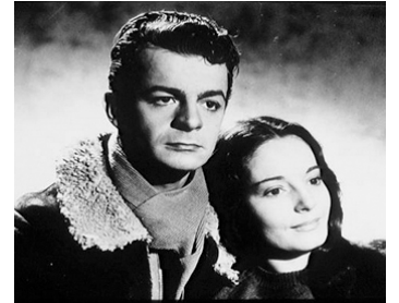
1949 AU ROYAUME DES CIEUX de Julien Duvivier avec Suzanne Cloutier