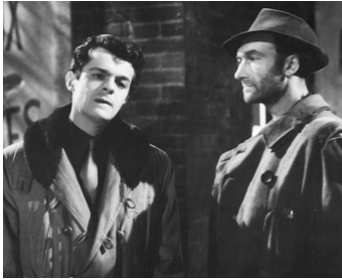
1946 LES PORTES DE LA NUIT de Marcel Carné avec Jean Vilar