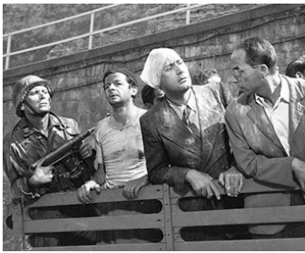
1960 LA GRANDE PAGAILLE (Tutti a casa) de Luigi Comencini avec Alberto Sordi