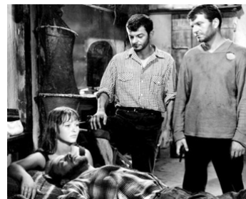
1955 LES SALAUDS VONT EN ENFER de Robert Hossein avec Marina Vlady, Henri Vidal