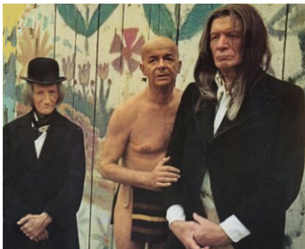
1973 TOUCHE PAS À LA FEMME BLANCHE de Marco Ferreri avec Alain Cuny