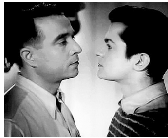
1943 LE CARREFOUR DES ENFANTS PERDUS de Léo Joannon avec René Dary