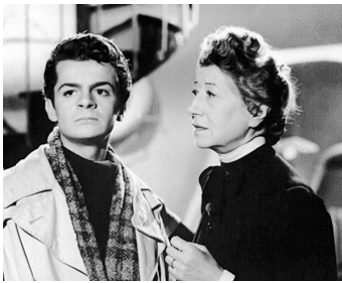
1942 LE VOYAGEUR DE LA TOUSSAINT de Louis Daquin avec Gabrielle Dorziat