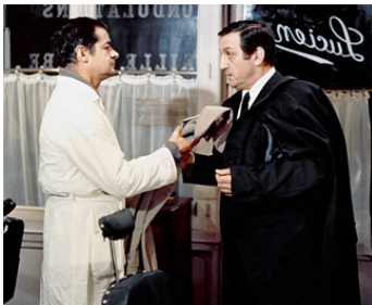
1968 L'ARMÉE DES OMBRES de Jean-Pierre Melville avec Lino Ventura