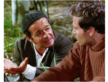
1967 LA MAFIA FAIT LA LOI (Il giorno della civetta) de D. Damiani avec Franco Nero