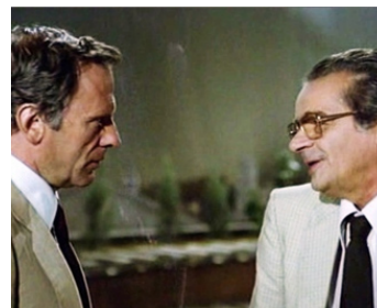
1978 LA TERRASSE (La Terrazza) d'Ettore Scola avec Jean-Louis Trintignant