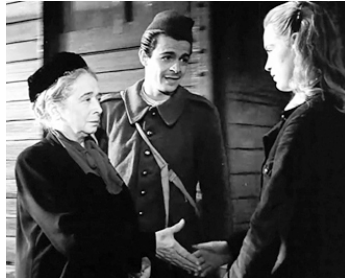
1949 RETOUR À LA VIE, Le Retour de Louis de J. Dréville avec C. Didier, Anne Campion