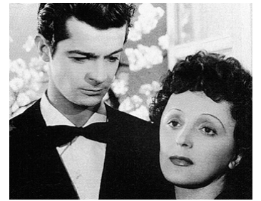
1945 ÉTOILE SANS LUMIÈRE de Marcel Blüstené avec Édith Piaf