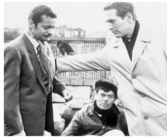
1961 PARIS BLUES (Paris Blues) de Martin Ritt avec Paul Newman