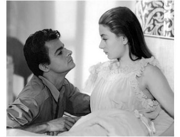
1948 LES AMANTS DE VÉRONE d'André Cayatte avec Anouk Aimée