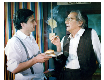
1990 J'AI ENGAGÉ UN TUEUR d'Aki Kaurismäki avec Jean-Pierre Léaud