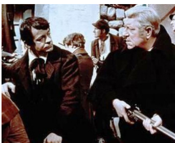
1957 LES MISÉRABLES de Jean-Paul Le Chanois avec Jean Gabin