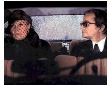
1975 LE CHAT ET LA SOURIS de Claude Lelouch avec Michèle Morgan