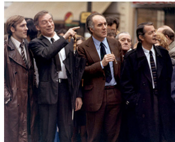
1974 VINCENT, FRANÇOIS PAUL ET LES AUTRES de C. Sautet avec G. Depardieu, Y. Montand, M. Piccoli