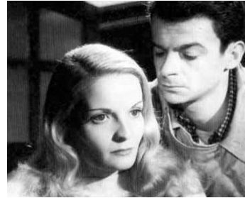
1947 LE DESSOUS DES CARTES d'André Cayatte avec Madeleine Sologne