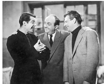
1950 LES ANCIENS DE SAINT-LOUP de Georges Lampin avec Bernard Blier, François Périer