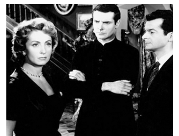
1958 MARIE-OCTOBRE de Julien Duvivier avec Danielle Darrieux, Paul Guers