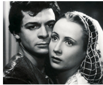
1945 FRANÇOIS VILLON d'André Zwoboda avec Renée Faure