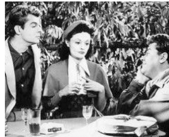
1950 UNE FILLE À CROQUER de Raoul André avec Louise Carletti, Francis Blanche