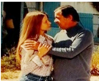
1976 UNE FILLE COUSUE DE FIL BLANC de Michel Blanc avec France Dougnac