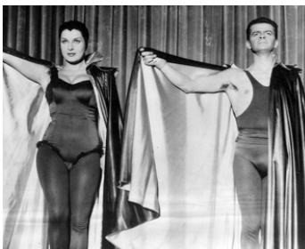
1951 FILLE DANGEREUSE (Bufere) de Guido Brignone avec Silvana Pampanini