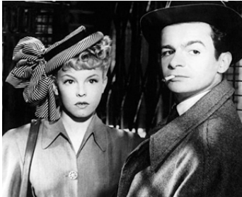
1948 MANON d'Henri-Georges Clouzot avec Cécile Aubry