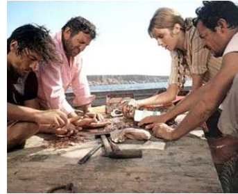
1966 LES AVENTURIERS de Robert Enrico avec Alain Delon, Lino Ventura, Joanna Shimkus