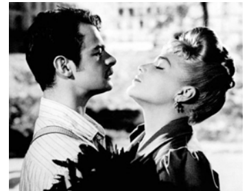
1951 CASQUE D'OR de Jacques Becker avec Simone Signoret