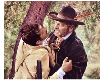
1962 LE GUÉPARD (Il Gattopardo) de Luchino Visconti avec Burt Lancaster