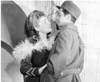
1950 LA RONDE de Max Ophüls avec Simone Signoret