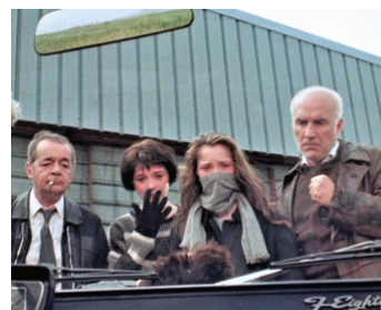
1986 MAUVAIS SANG de Léos Carax avec Juliette Binoche, Julie Delpy, Michel Piccoli