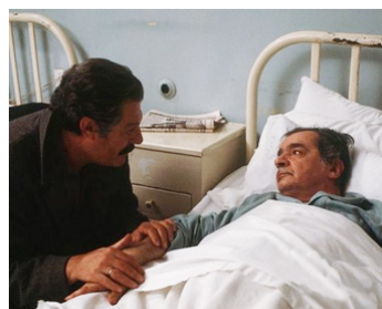
1985 L'APICULTEUR (O Melissokomos) de Theo Angelopoulos avec Marcello Mastroianni