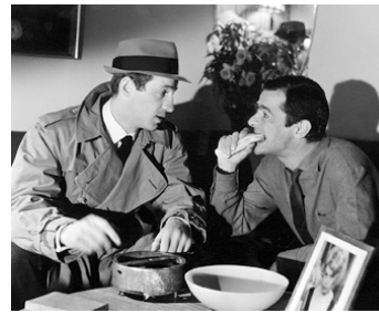
1962 LE DOULOS de Jean-Pierre Melville avec Jean-Paul Belmondo