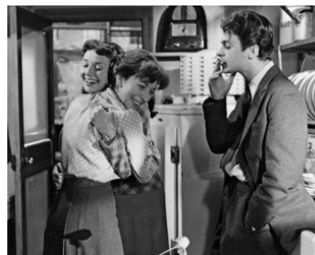
1952 THE SECRET PEOPLE de Thorold Dickinson avec Audrey Hepburn, Valentina Cortese