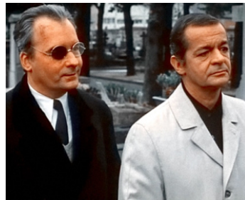
1969 COMPTES À REBOURS de Roger Pigaut avec Michel Bouquet