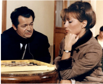
1965 MARIE-CHANTAL CONTRE DOCTEUR KHA de Claude Chabrol avec Stéphane Audran