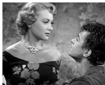
1957 LE PASSAGER CLANDESTIN de Ralph Habib avec Martine Carol